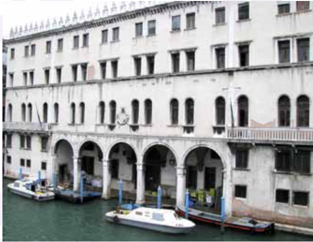
Фондако деи Тедески. В немецком коммерческом доме на третьем этаже веками тайно проводились протестанские обряды.

Венецианская Евангельская Лютеранская община является старейшей Лютеранской общиной Италии, а также одной из самых старейших за пределами Германии. Задолго до первых публикаций Мартина Лютера мысли о реформации нашли своих приверженцев в городе - лагуне. Гаспар Контарини (1483-1542) родом из Венеции, ставший впоследствии кардиналом, уже в 1511 году во время пасхальной исповеди утверждает что человек спасается не через дела свой, а через