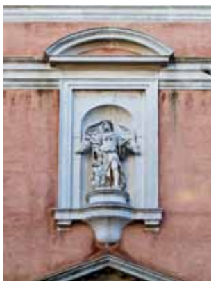
Ангел Хранитель на фасаде церкви

Венецианская Евангельская Лютеранская община является старейшей Лютеранской общиной Италии, а также одной из самых старейших за пределами Германии. Задолго до первых публикаций Мартина Лютера мысли о реформации нашли своих приверженцев в городе - лагуне. Гаспар Контарини (1483-1542) родом из Венеции, ставший впоследствии кардиналом, уже в 1511 году во время пасхальной исповеди утверждает что человек спасается не через дела свой, а через